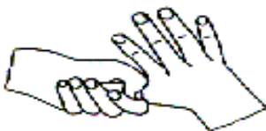
5.拇指在掌中转动搓擦