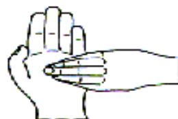
6.指尖在掌心中搓擦